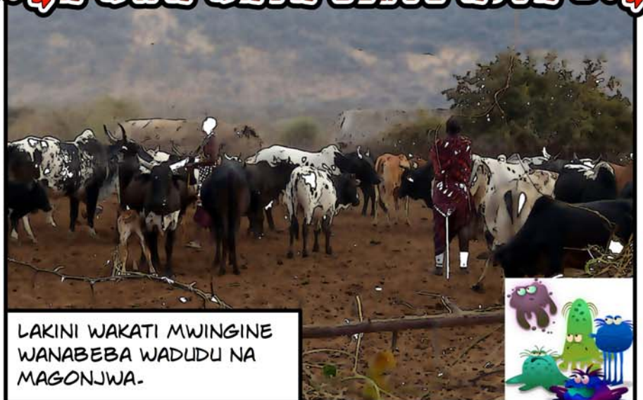
LAKINI WAKATI MWINGINE WANABEBA WADUDU NA MAGONJWA.