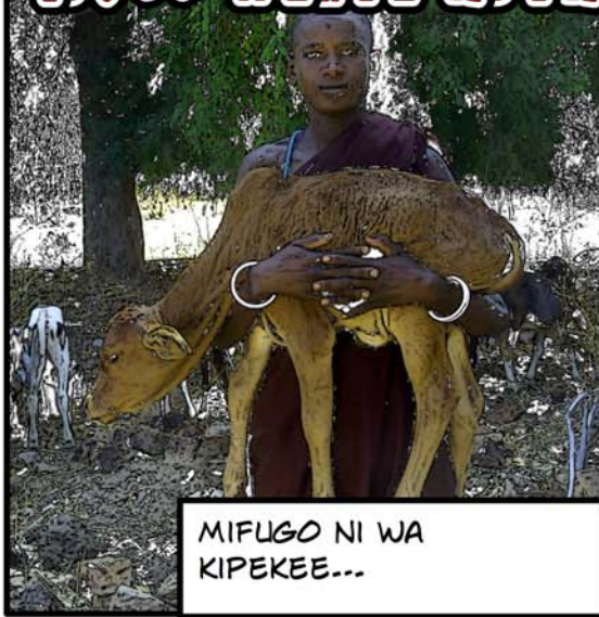
MIFUGO NI WA KIPEKEE...