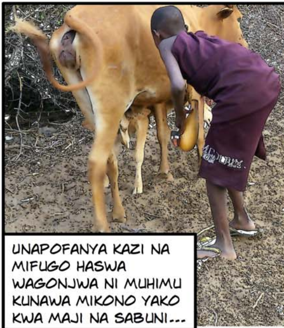
UNAPOFANYA KAZI NA MIFUGO HASWA WAGONJWA NI MUHIMU KUNAWA MIKONO YAKO KWA MAJI NA SABUNI!...