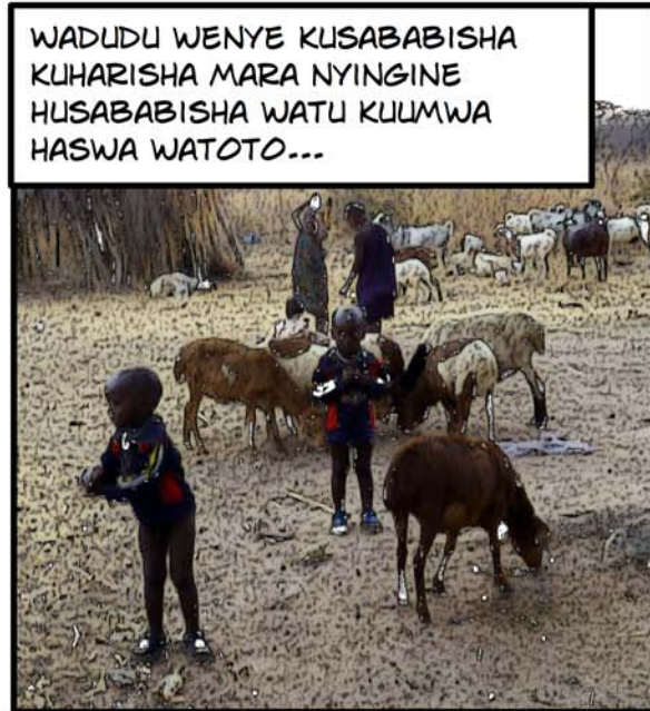
WADUDU WENYE KUSABABISHA KU HARISHA MARA NYINGINE HUSABABISHA WATU KULMWA HASWA WATOTO...