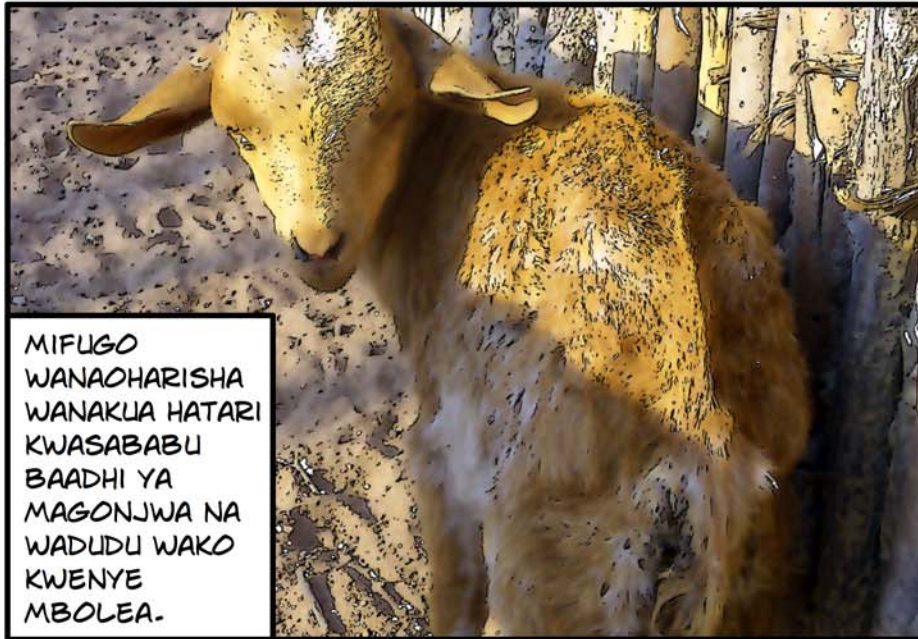
MIFUGO WANA HARISHA WANAKUA HATARI KWASABABU BAADHI YA MAGONJWA NA WADUDU WAKO KWENYE MBOLEA.