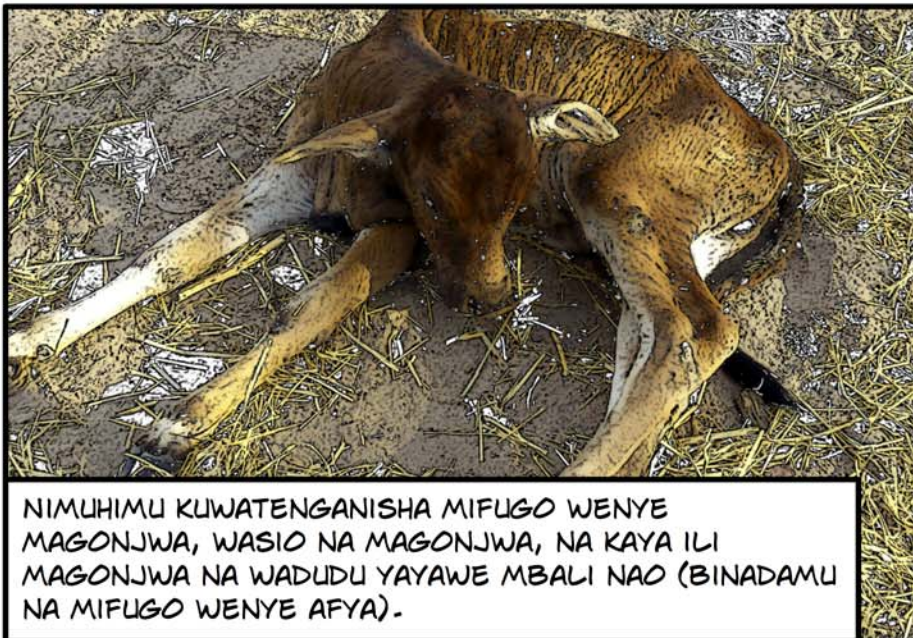
NIMUHMU KUWATENGANISHA MIFUGO WENYE MAGONJWA, WASIO NA MAGONJWA, NA KAYA ILI MAGONJWA NA WADUDU YAYAWE MBALI NAO (BINADAMU NA MIFUGO WENYE AFYA).